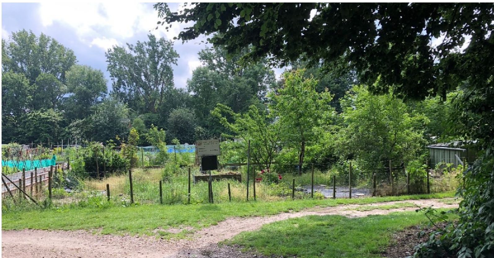
Afbeelding4: ingang volkstuincomplex