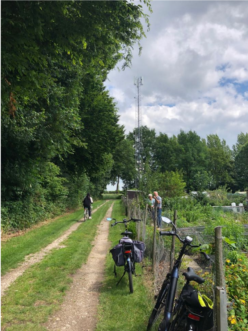
Afbeelding 5: toegang zendmast