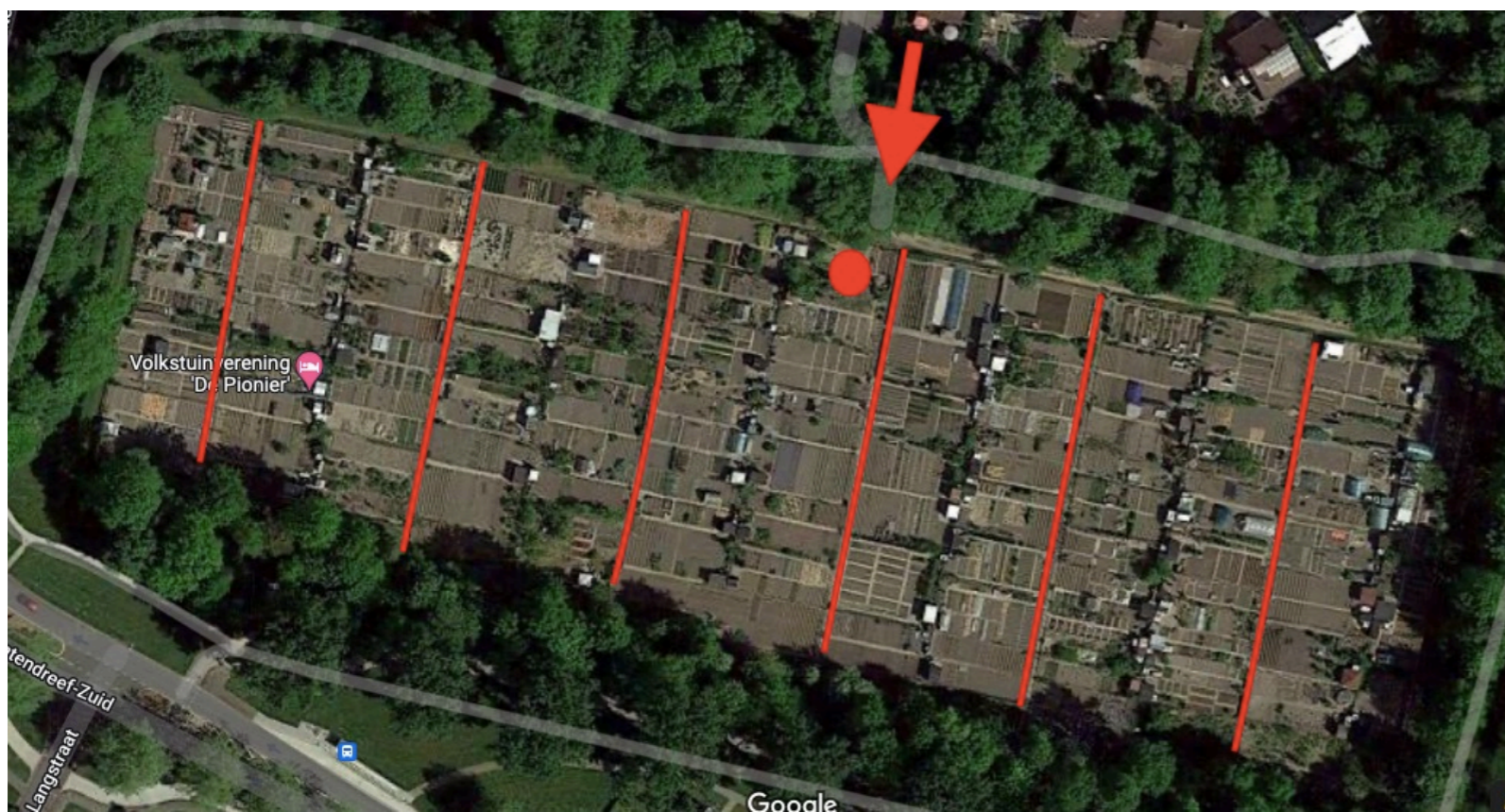
Afbeelding 3: situatie volkstuincomplex