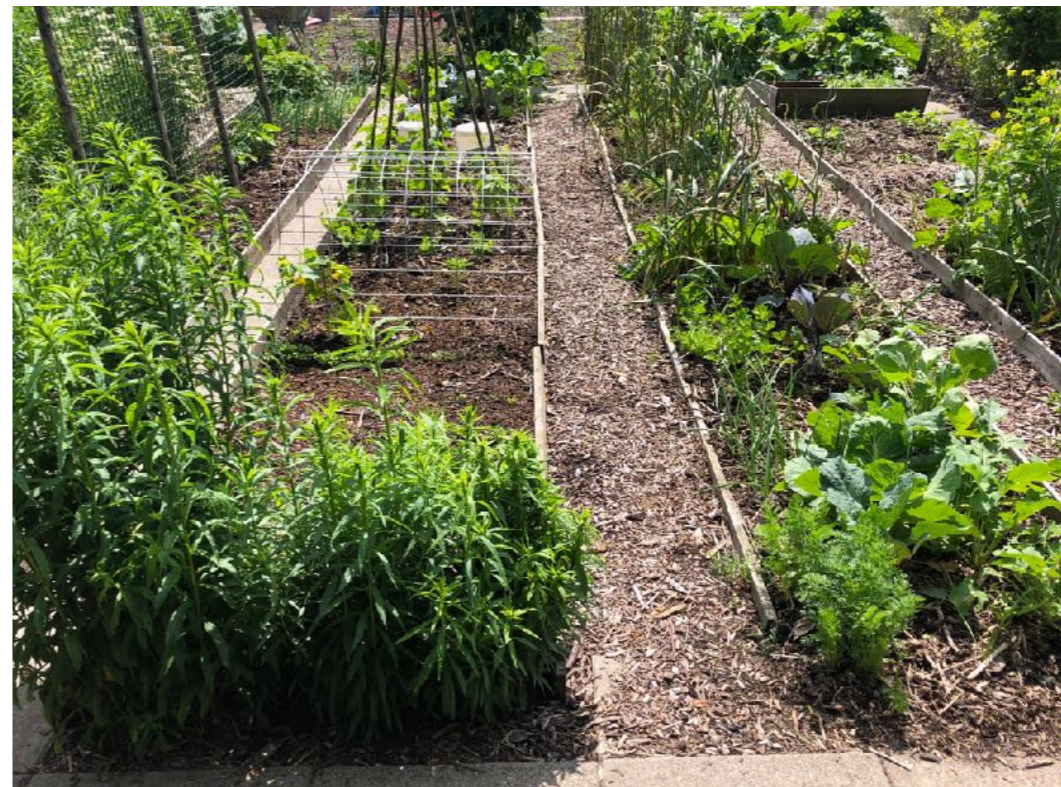
Afbeelding 2: moestuin

Het voorstel is om bij de ingang van het complex duidelijkere bebording aan te brengen en de verharding aan te laten sluiten met het voetpad. Zie de rode pijl in afbeelding 3. De gemeente heeft toegezegd dit jaar het pad naar de zendmast van nieuw puin te voorzien. Zij zijn ook bereid de toegang bij de parkeerplaats naar het complex te verharderen zodat het complex makkelijker bereikbaar wordt voor minder validen.