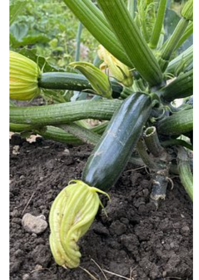
Uitwisselen van kennis