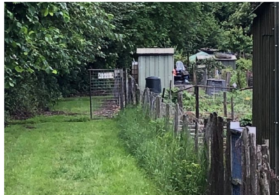
Afbeelding 6: buitenrand van het complex met klaphek

Het plan is om de voetpaden te herstellen en iets te verbreden. Mogelijk kan een andere verharding worden aangebracht zodat ook met een rollator of een rolstoel over het voetpad kan worden gelopen (of een gedeelte binnen het complex).