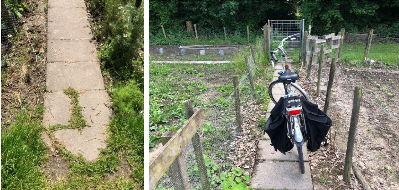
Afbeelding7: voetpaden tussen de tuintjes