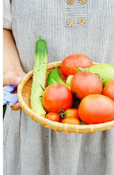
Samen oogst delen